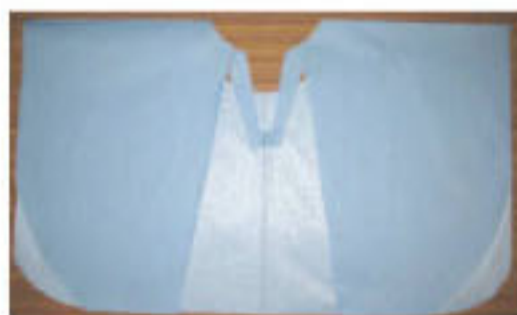
当院で使用している検査着