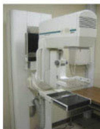
当院のマンモグラフィ装置