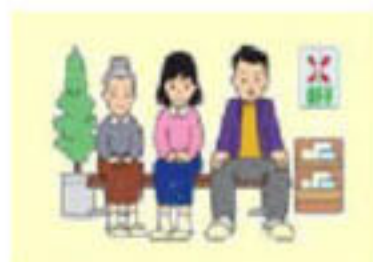
放射線科TQMグループ

撮影したフィルムをお渡しますので、放射線科受付の前でお待ち下さい。フィルムをもって受診外来受付にお渡し下さい。